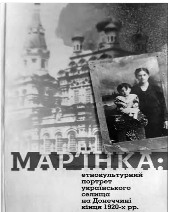
етнокультурний портрет українського селища на Донеччині кінця 1920-х рр.